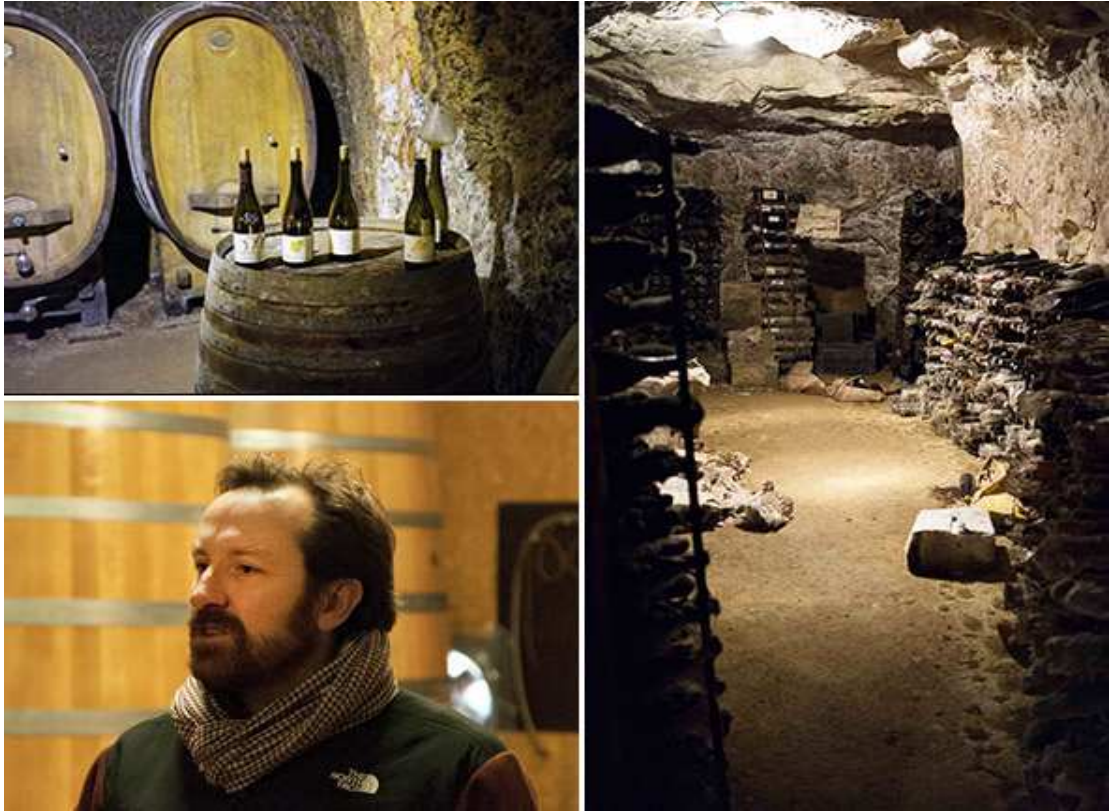
Domaines de la Charrière (Gigou) - Clos St-Jacques 2010 AOP Jasnières

geveer 4 maanden in beslag waarna de wijn verder wordt opgevoed sur lies fines gedurende 12 maanden en dit alles op lage temperatuur en, zoals reeds aangegeven, op nieuwe eik.