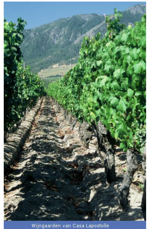
Wijngaarden van Casa Lapostolle

Alexandra is in haar avontuur niet over één nacht ijs gegaan. Ze bekeek wijngebieden over de hele wereld alvorens ze in Rapel Valley in Chili terecht kwam, dat op dezelfde breedtegraad ligt als de beste wijngebieden van Zuid-Afrika en Australië. Alexandra zag onmiddellijk de potentie van het gebied met zijn oude wijngaarden, zijn arme grond en ideale klimaat. Met behulp van Michel Rolland, een wereldwijd befaamd wijnmaker uit Bordeaux, werd de wijnmakerij compleet gerenoveerd. Er werden 30 roestvrijstalen tanks gebouwd en er werden 3.500 eiken vaten aangekocht. Rolland's meesterschap en perfectionisme pasten uitstekend bij Alexandra's droom. Het hele proces vanaf het plukken tot en met het bottelen werd vanaf dat moment nauwkeurig gecontroleerd. Er wordt met de hand geplukt, beschadiging van de druiven wordt tegengegaan door kleine verzamelmatten te gebruiken en er vindt een handmatige controle van de geplukte druiven plaats.